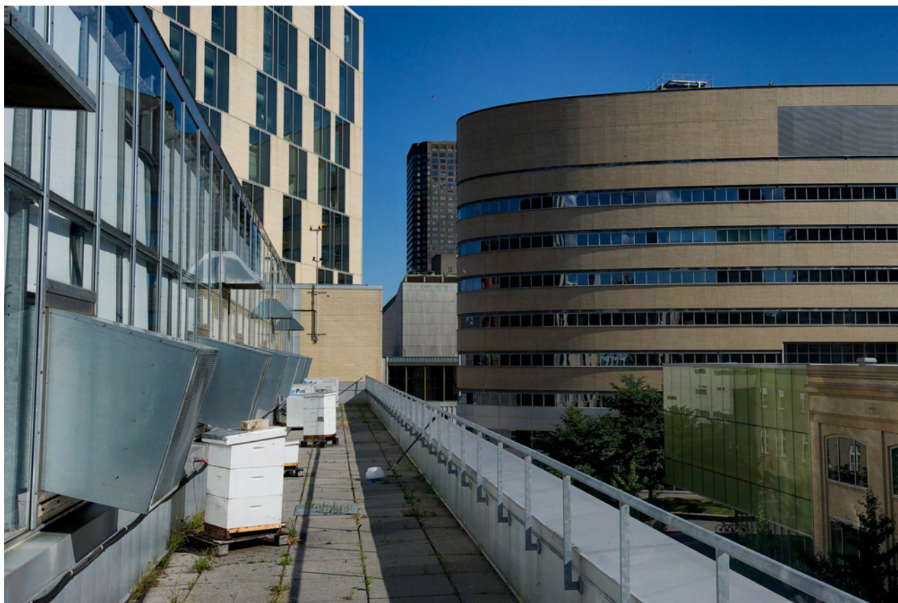
FIGURE 7. L'installation des ruches dans les milieux urbains — tout comme dans les milieux semi-naturels — a le vent en poupe, mais cette démarche n'est pas dénuée de risques.

On devrait bien entendu interdire les ruches dans des espaces ultra-sensibles où subsistent des populations relictuelles d'espèces rares, en particulier celles qui sont spécialisées d'un point de vue alimentaire, et on devrait aussi limiter l'implantation de ruches dans des espaces sensibles, mais nul n'imagine un seul instant d'interdire l'apiculture ! Et quoi que l'on fasse, les contacts entre l'abeille domestique et les hyménoptères sauvages persisteront. C'est pourquoi comme d'autres auteurs (Manley et al. 2015) nous pensons que la meilleure mesure pour limiter la contamination de ces derniers est de rétablir autant qu'il sera possible la santé des abeilles domestiques – a) en contrôlant le Varroa , Nosema ceranae et les autres pathogènes dans les élevages, - b) en préservant les capacités immunitaires de l'abeille domestique par un environnement riche en ressources florales variées (ce que ne sont pas les cultures industrielles, même entomophiles comme le colza ou le tournesol) et – c) en préservant les abeilles des contaminants chimiques (qu'il s'agisse de pesticides ou de médicaments non autorisés). Apiculteurs et protecteurs des hyménoptères sauvages ont, à ce titre, les mêmes objectifs.