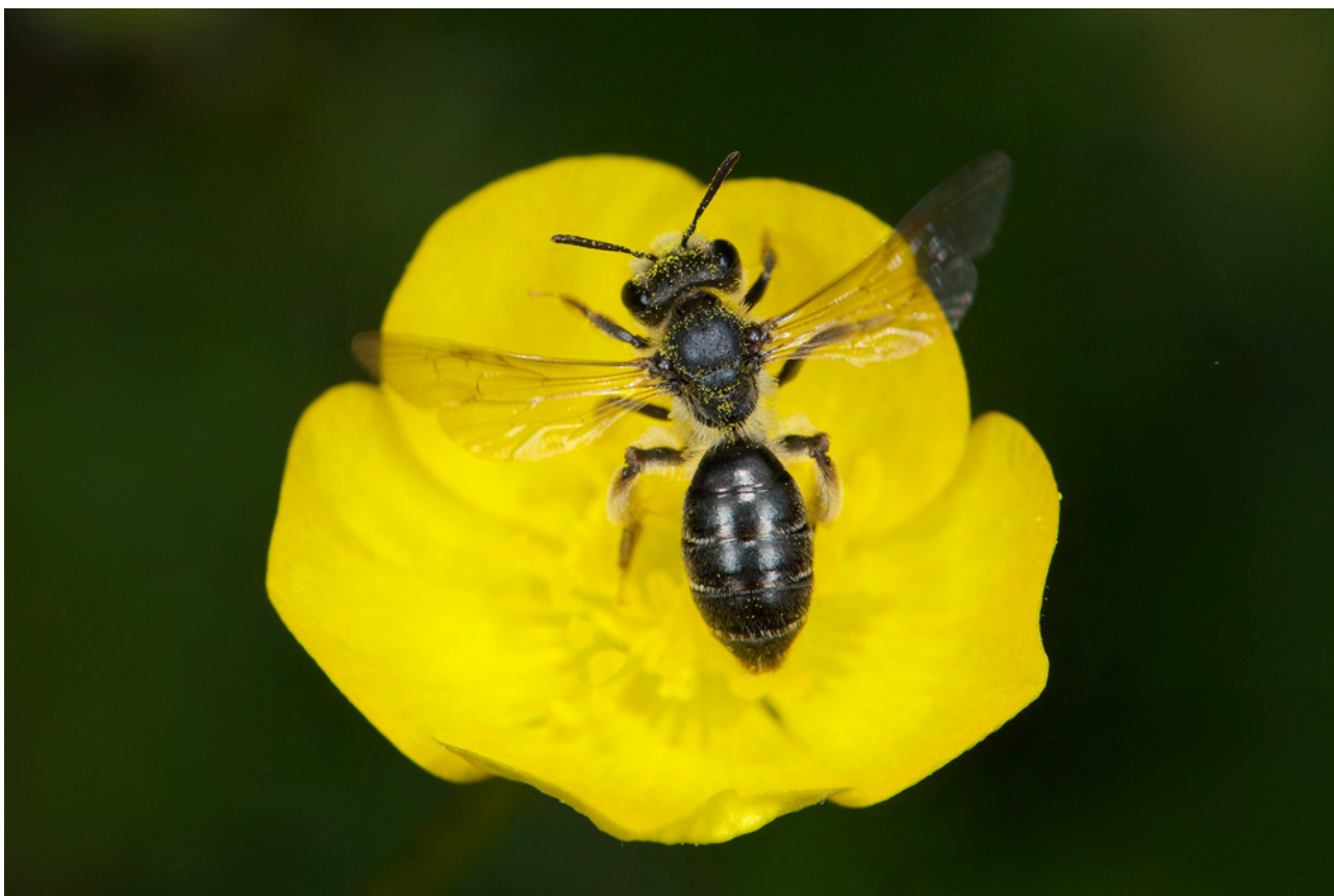
FIGURE 4. Les femelles de l'andrène des renoncules, Andrena ranunculi (Andrenidae) sont oligolectiques : ne récoltent du pollen que sur certaines plantes particulières, ici les renoncules.

de plantes (Cane & Sipes 2006; Müller & Kuhlmann 2008). L'abeille domestique est l'espèce la plus largement polylectique d'Europe puisqu'elle peut récolter localement du pollen sur des plantes de plusieurs dizaines de familles botaniques, y compris de nombreuses espèces introduites ou pollinisées par le vent comme le châtaignier, le chêne ou le maïs. Ainsi, en analysant, au sein d'un paysage de grandes cultures (Deux-Sèvres, France) et pendant cinq années consécutives, les ressources ramenées à la ruche, Requier et al. (2015) ont mis en évidence que les colonies étudiées ont ramené du pollen issu de 228 espèces différentes (sur ce thème, voir aussi le projet FlorApis, http://www.florapis.org/ ). Même si une ouvrière de l'abeille domestique ne visite généralement qu'un type de fleurs en se spécialisant par exemple sur un type donné de morphologie florale, toutes les butineuses d'une même colonie ne visitent pas les mêmes espèces végétales. Il en résulte que même si une espèce florale visitée par l'abeille domestique domine, les espèces florales moins abondantes localement seront aussi visitées par d'autres ouvrières. Si l'on excepte les fleurs à corolle profonde qui ne peuvent être visitées que par les insectes qui ont la langue assez longue comme les bourdons, le spectre alimentaire de l'abeille domestique recouvre donc largement celui de l'ensemble des abeilles sauvages, ces dernières ayant toutes un spectre alimentaire plus étroit (Thorp 1996).