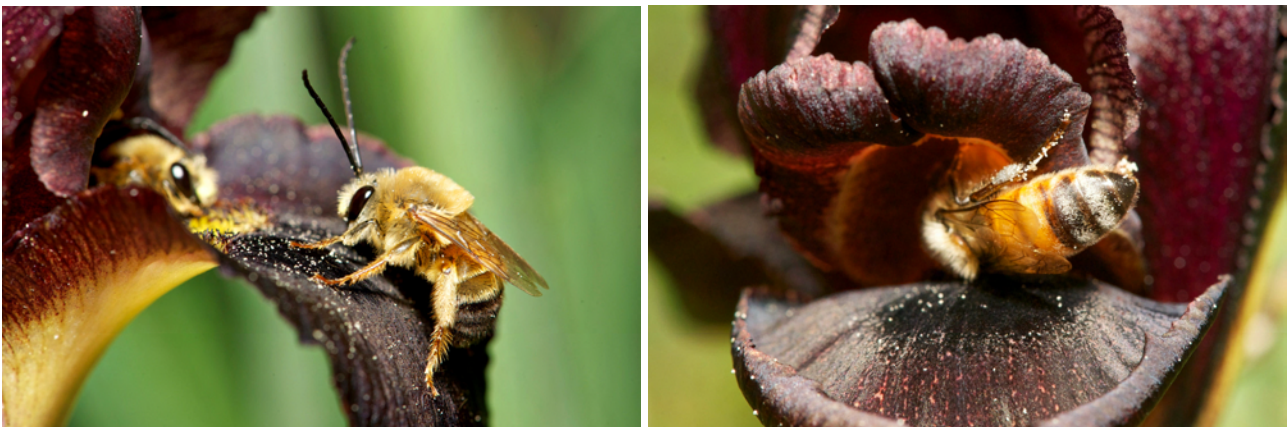
FIGURE 6. Iris atropurpurea est une plante adaptée à la pollinisation par les mâles d'abeilles sauvages (gauche, ici Synhalonia spectabilis , Apidae) qui s'y réfugient pour la nuit ou pendant les périodes d'intempéries. Là où les ruches sont installées, les ouvrières de l'abeille domestique récoltent activement du pollen pendant la journée, pollinisant les Iris par la même occasion, attirées par des motivations alimentaires (pollen) et non pas par la recherche d'un refuge nocturne. Ces différences de "motivations sensorielles" qui peuvent se traduire par de la pollinisation efficace peuvent entraîner des différences de régimes de sélection et donc influencer l'évolution phénotypique des plantes si l'activité apicole se maintient au sein ou à proximité des populations d' Iris atropurpurea .

A ce jour, il existe un nombre limité de travaux portant sur la perturbation des communautés végétales en liaison avec l'installation de ruches. Si l'installation de ruches de l'abeille domestique peut effectivement augmenter la fréquence des visites florales par les ouvrières, ce qui soit dit en passant peut notamment favoriser l'installation locale d'espèces invasives (voir p.ex. l'effet sur Lythrum salicaria en Amérique du Nord: Mal et al. 1992; Barthell et al. 2001), certaines études indiquent que les hautes densités d'abeilles peuvent également avoir un impact négatif sur le succès reproductif des plantes, notamment à cause du prélèvement important de pollen (Hargreaves et al. 2009), de nectar (Kenta et al. 2007), les dégâts occasionnés sur les fleurs (Dohzono et al. 2008) ou la perturbation des patrons de flux de pollen entre plantes impliquées dans des interactions hautement spécialisées avec les pollinisateurs sauvages (Vaughton 1996; Gross & Mackay 1998; Watts et al. 2012).