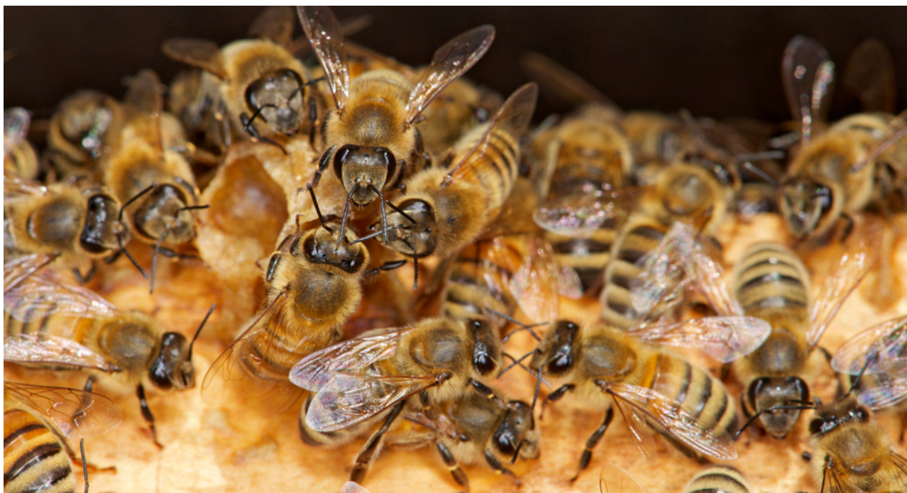
FIGURE 1. Ouvrières de l’abeille domestique ( Apis mellifera ) au coeur de la ruche.

Pour endiguer voire contrer le déclin des abeilles, certains acteurs (associations, syndicats apicoles, entreprises, etc.) préconisent l’installation et la multiplication des colonies (ruches) de l’abeille domestique ( Apis mellifera , FIGURE 1) dans les habitats (semi-) naturels, les réserves naturelles, ainsi que dans les villes ou dans les parcs industriels. Ces initiatives qui se répandent rapidement sont à l’origine d’une réflexion conduite au sein de l’Observatoire des Abeilles (OA, www.oabeilles.net ), une association de loi 1901 qui s’est donné pour mission l’étude de l’écologie et de la conservation des abeilles sauvages dans leurs habitats naturels. Notre expérience scientifique, notre connaissance des abeilles sauvages et de l’abeille domestique, nos nombreux échanges avec diverses associations naturalistes, des gestionnaires de milieux semi-naturels, des apiculteurs dont certains approuvent ce texte, et avec les médias nous ont encouragés à faire le point sur cette question et à proposer des pistes pour que cohabitent toujours en “bonne entente” Apis mellifera , l’espèce domestiquée, et ses cousines sauvages.