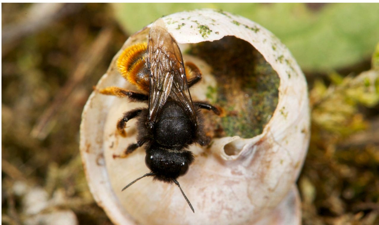
FIGURE 3. L'osmie bicolore ( Osmia bicolor , Megachilidae) fait partie des espèces d'abeilles sauvages à l'écologie très spécialisée : les femelles établissent leur nid (leur "gîte") exclusivement dans des coquilles d'escargots. Photo NJ Vereecken

Le gîte. Contrairement à l'abeille domestique qui bénéficie du gîte assuré par l'apiculteur, les abeilles sauvages doivent trouver elles-mêmes les sites favorables pour nidifier. Certaines espèces font leurs nids avec des matériaux comme de la résine, des fragments de feuilles, des pétales de fleurs, de la boue, beaucoup creusent leur nid dans le sol alors que d'autres creusent le bois mort ou exploitent des coquilles vides d'escargots (FIGURE 3). Or, la faible surface des zones protégées, la régression massive des milieux "interstitiels" et des milieux refuges semi-naturels tels que les bordures des champs à proximité des prairies retournées régulièrement et amendées, a pour conséquence une diminution drastique des sites de nidification disponibles et des matériaux utilisés par de nombreuses espèces d'abeilles sauvages pour la construction de leur nid.